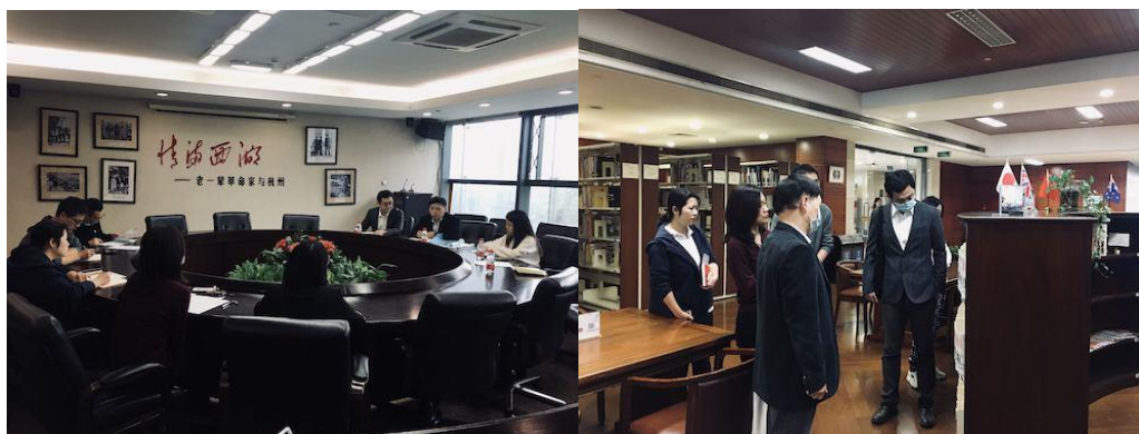
与市图书馆交流座谈

10月27日，为完善杭州市决策咨询委员会委托研究课题《发挥亚运综合效应，进一步提升杭州东方文化国际交流重要城市影响力的对策研究》，我院课题组前往杭州市图书馆及杭州市文广旅游局开展调研。市图书馆领导介绍了图书馆公共文化建设特色及相关国际交流项目实践，接着课题组在市图书馆工作人员的陪同下参观了国际友好交流图书展区及亚运活动空间。随后，课题组与市文广旅游局进行了座谈交流，国际交流与推广处、公共服务处、非物质文化遗产处、艺术处及文旅推广中心等相关部门参与，分别介绍了国际交流与文化推广工作的特色及亚运会期间相关国际文化交流活动安排。