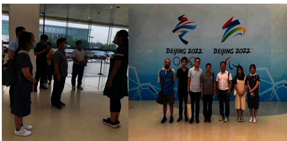
赛后场馆利用考察