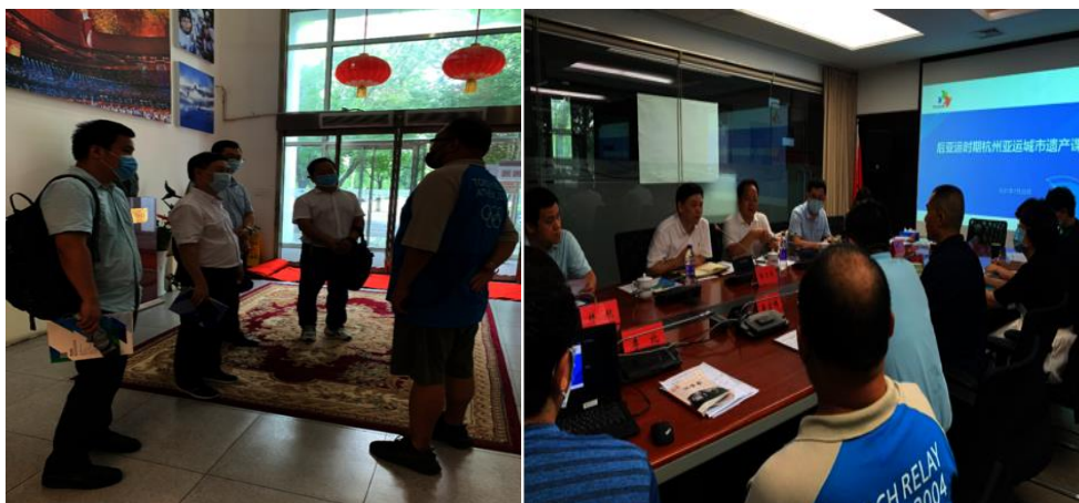
与奥促中心相关部门座谈