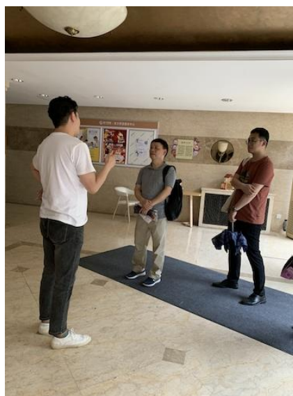
北京双井街道考察

7月21日，课题组首先参观考察了北京双井街道，了解社区精细化治理及公共空间的改造的相关经验。