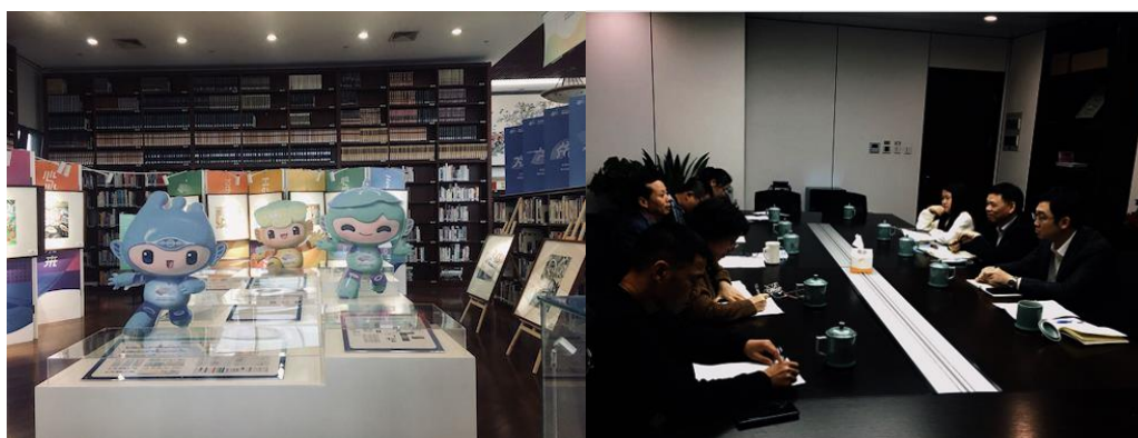
参观市图书馆亚运活动空间